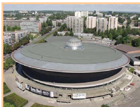
"Spodek" de Andrzej ZORAWSKI. Symbole architectural de Katowice

La quatrième édition du festival Mondial d'Art Naif de Katowice sera marquée par la volonté d'associer les structures touristiques de la région de Katowice à l'impact de cette manifestation culturelle inédite en Pologne qui redonne des couleurs à une ancienne cité minière.